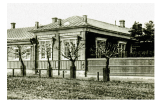
■ Челябинская женская гимназия

Истоки женской гимназии относятся к 1861 г., когда в Челя-