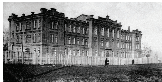
■ Реальное училище

Реальное училище – первое среднее учебное заведение Челябинска. Было открыто 5 октября 1902 г. Первоначально своего здания