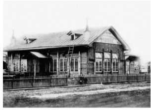
■ Мужское железнодорожное училище в Никольском поселке

Отрванность до революции привокзальной территории от города привела к тому, что учебные заведения возникали там по линии духовного, военного и железнодорожного ведомств, а потому информации о них в краеведческих изданиях крайне мало. Известно, что в Никольском казачьем поселке было три начальные школы, чьи программы были близки городским низшим начальным училищам, т.е. давали элементарную грамотность. Мужское училище в Никольском поселке – одно из таких училищ. 18 апреля 1903 г. училище посетил военный министр А. Н. Куропаткин. Генерал с одобрением отметил здоровый вид учащихся, подчеркнув: «Защитники Отечества!», в беседе с учителями говорил о важности устной беседы как формы педагогической работы.