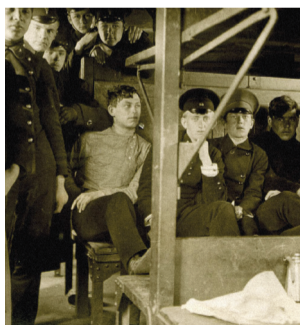
■ Учащиеся Торговой школы на экскурсии

революционного Челябинска. Оно возникло в 1909 г. по инициативе известного челябинского мецената и предпринимателя В. К. Покровского (1843–1913) и находилось в ведении Министерства торговли и промышленности. Предполагалось, что школа должна была готовить конторских служащих для торговых и промышленных заведений. Сначала в школе учились только мальчики. Но осенью 1916 г. эта традиция была нарушена – учащимися школы стали первые 14 девочек. При школе имелись библиотека, физический кабинет, химическая и товароведческая лаборатории, музей и даже