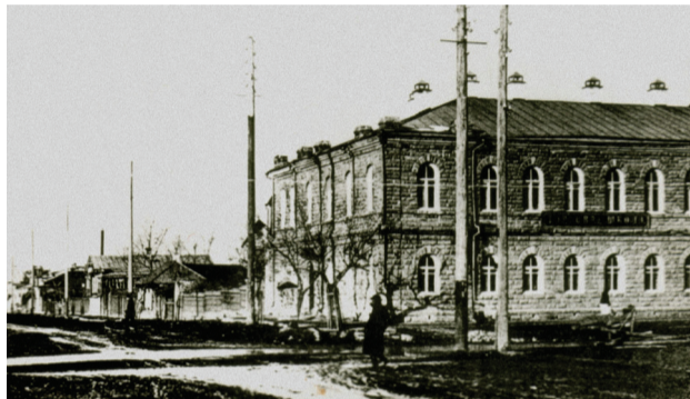
■ Торговая школа

Торговая школа – одно из интереснейших учебных заведений до-