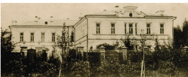
■ Духовное училище. Вид с севера

Мужское духовное училище было открыто в Челябинске по инициативе ректора Оренбургской семинарии архимандрита Феодотия в октябре 1830 г. Первоначально училище включало в